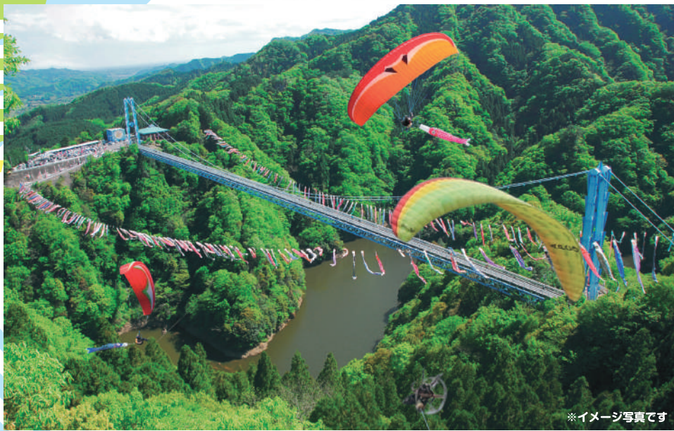
※イメージ写真です